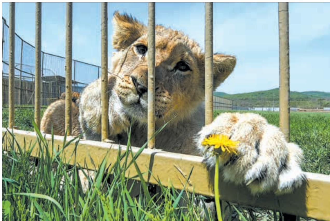
РОССИЯ. Приморский край. Львенок в вольере ландшафтного сафари-зоопарка «Белый лев» в Надеждинском районе.