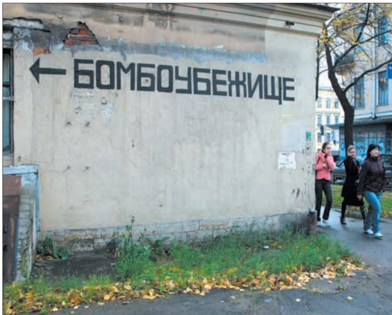
Таких объектов на случай ядерной войны в городе было достаточно много.