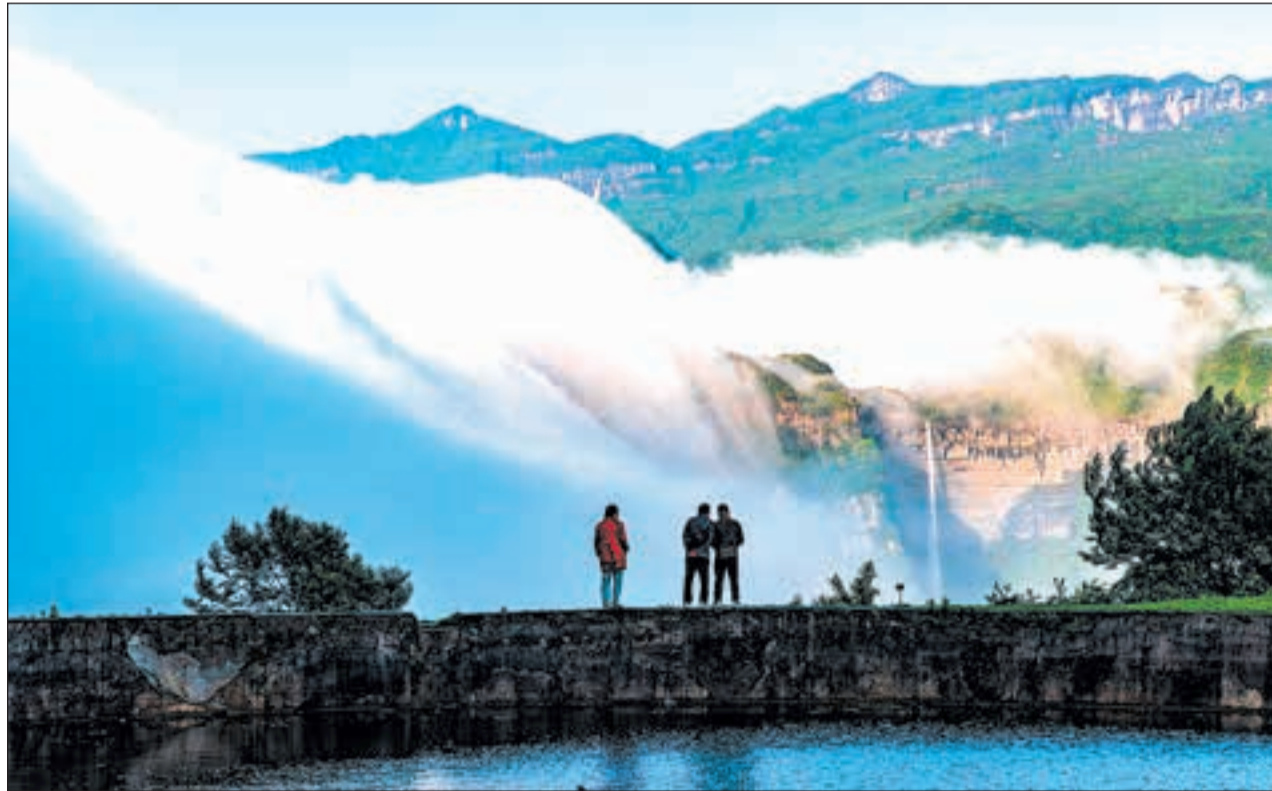
КНР. Природное явление «водопад из облаков» у подножия горы Цзиньфо на юго-западе страны.